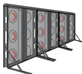
STADIUM LED DISPLAY